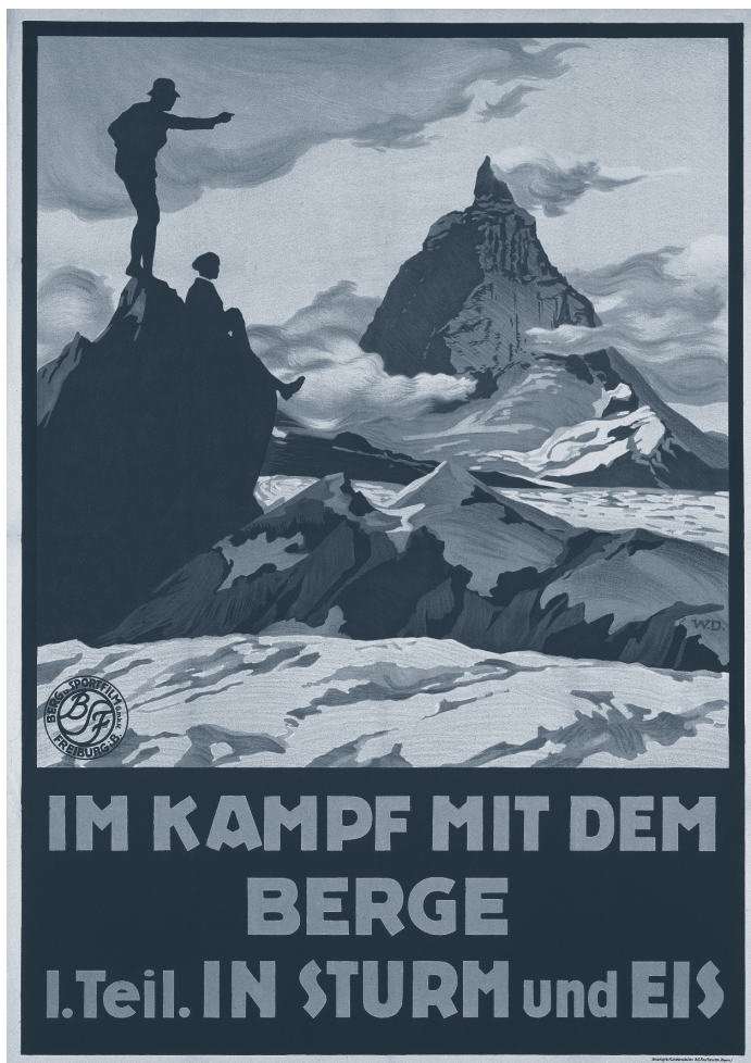
Filmplakat „In Sturm und Eis“ 1921