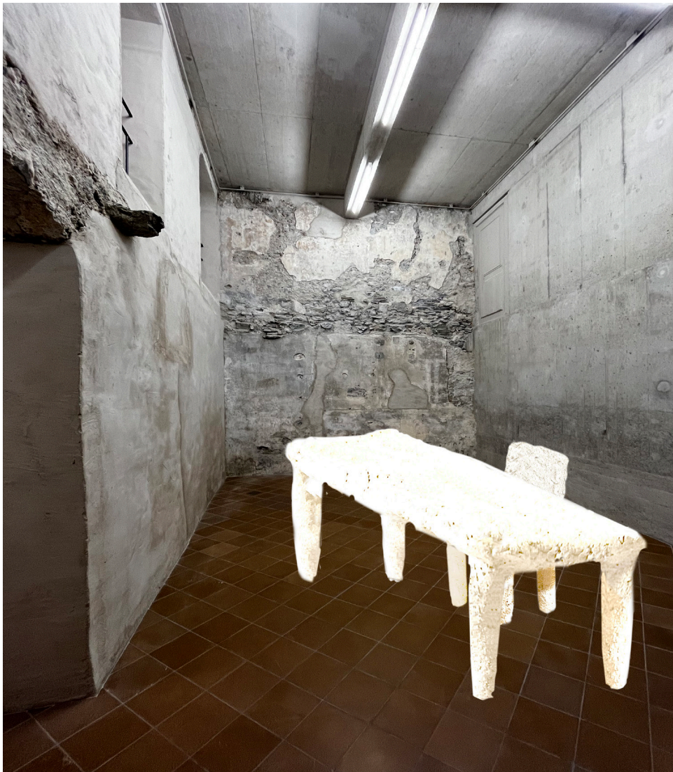
Absence, photomontage, 220x95x76 cm et 42x46x86 cm

L'installation symbolise l'absence à travers deux objets familiers : une table et une chaise. Ces objets réalisés en papier sont présents sous une forme inhabituelle. Avec leurs bords irréguliers, ils sont réduits à des silhouettes fragiles, où chaque pli, chaque déchirure dans la surface de la table et de la chaise en papier devient une marque du temps qui passe, une trace de ce qui a été. Dans cette œuvre, on ne trouve pas seulement un vide, mais une mémoire. Le papier garde une empreinte, une texture. Souvent associé à l'écrit, à l'expression de l'individu, ce matériau est un support qui, par son caractère fragile, nous rappelle que tout ce qui existe est voué à se transformer, à s'effacer, à disparaître.