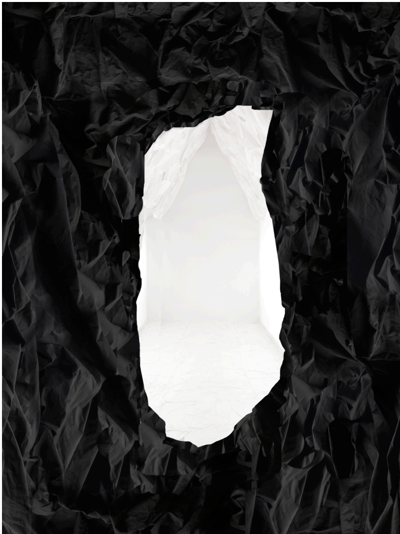
Ailleurs, photomontage, 430x260x260 cm

De pièce en pièce, le cheminement suit une progression jusqu'au deuxième espace à double hauteur au nord de la galerie [salle no6]. Un bloc massif, comme une météorite tombée d'on ne sait où, l'occupe entièrement. La grandeur imposante du rocher de papier, fragment d'un monde lointain, dégage l'impression de permanence. Il incarne le monde tangible et immuable, le monde des choses concrètes et mesurables. Ce roc imposant constitue une enveloppe extérieure qui abrite un autre monde. À travers une fente du rocher semblable à l'entrée d'une grotte ou d'un sanctuaire, on découvre une maison toute blanche, baignée d'une lumière venue d'ailleurs. Elle semble être un refuge dans un monde parallèle paisible et insaisissable. Le matériau papier de l'installation, pourtant fragile, a été choisi pour sa capacité à symboliser la solidité tout en restant éphémère, et permettre le contraste entre la dureté de la pierre et la douceur de la lumière.