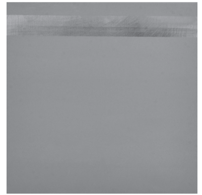
Ohne Titel, Öl auf Leinwand, 40 x 40 cm, 2016