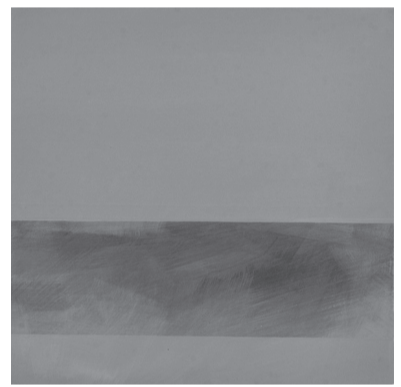
Ohne Titel, Öl auf Leinwand, 40 x 40 cm, 2016