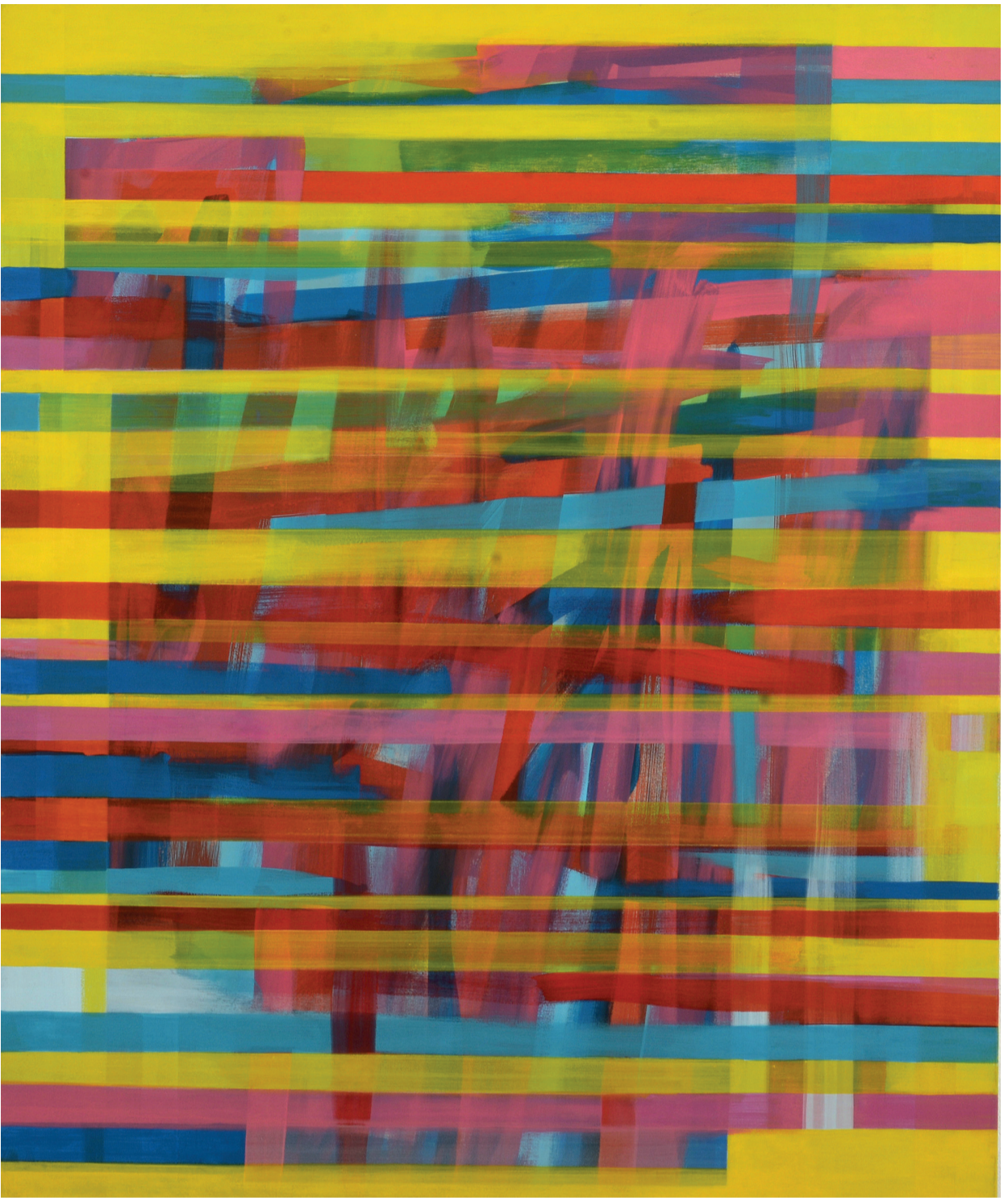
Ohne Titel, Öl auf Leinwand, 100 x 120 cm, 1998