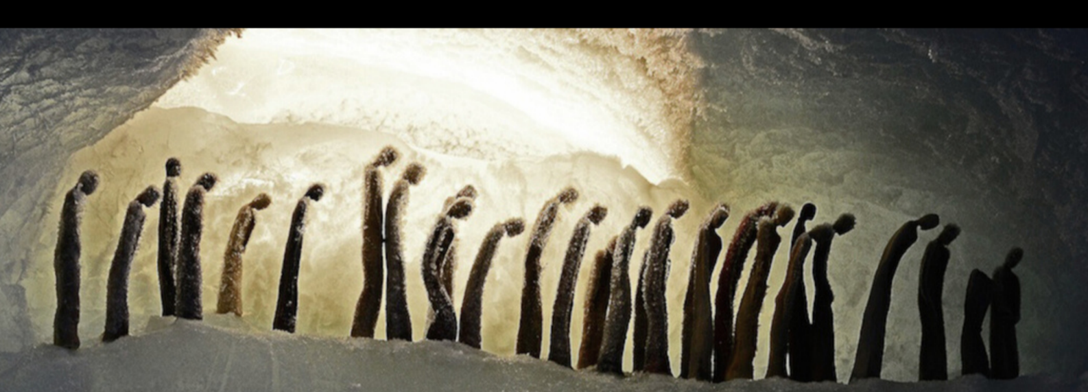
Graatzug in Keramik: Katrin Riesterer-Imboden