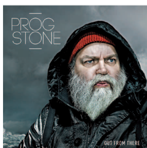
2014 OUT FROM THERE (Album)