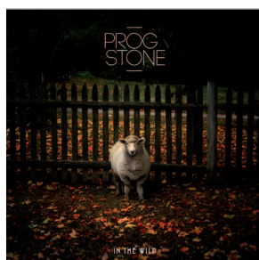
2012 IN THE WILD (EP)