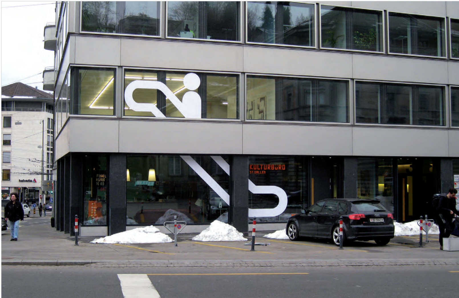
UPSTAIRS! 2013 SCHAUFENSTERFOLIE AUSSENARBEIT ZUR NEUERÖFFNUNG NEXTEX ST.GALLEN IM 1.STOCK