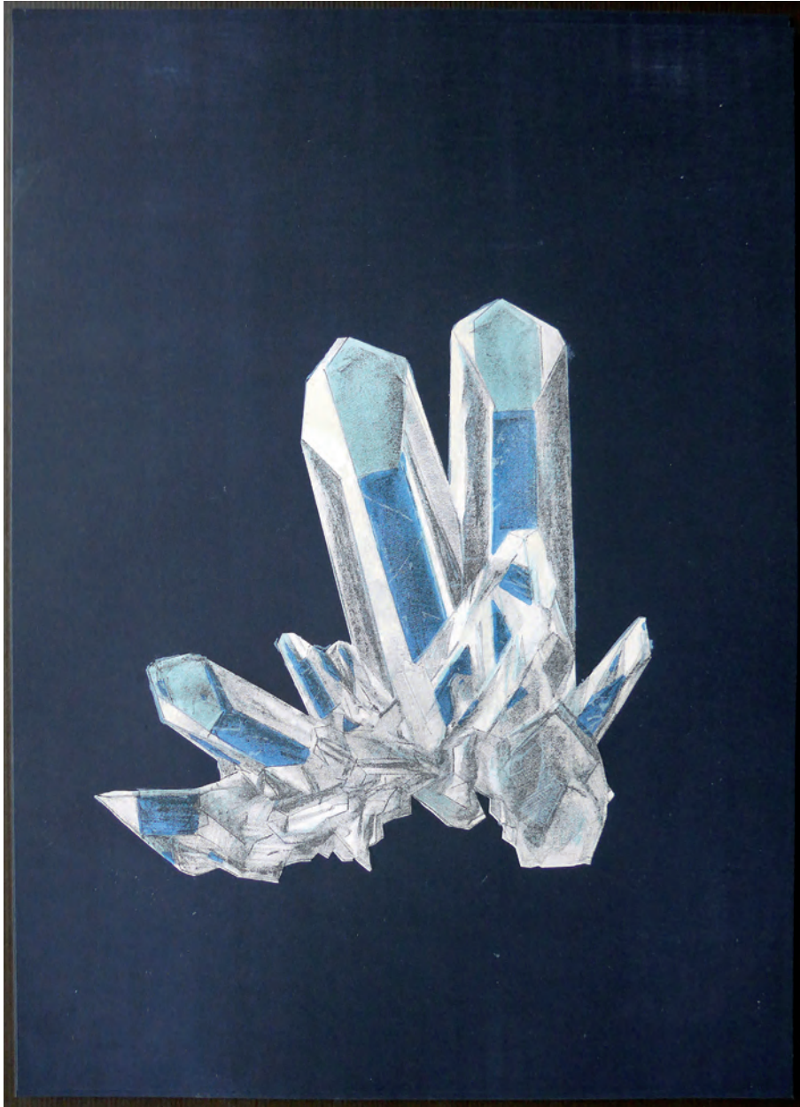
KRISTALL 2016 LITHOGRAPHIE 46 X 34 CM 1/3