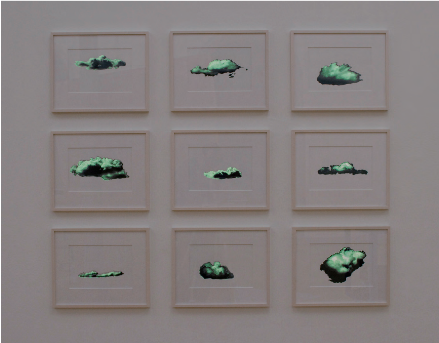
CLOUDS 2013 DUPLEX SIEBDRUCK MIT PHOSPHORFARBE 5 EDITIONEN MIT 9 WOLKEN 34 X 42 X 2.5 CM