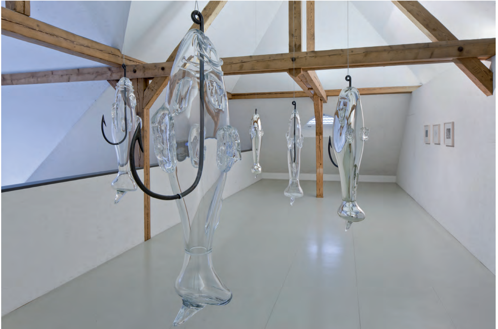
AQUARIUM 2014 5 KUNSTKÖDER AUS GLAS, DAVON ZWEI VERSPIEGELT GRÖSSE VARIABEL KUNSTHALLE WIL