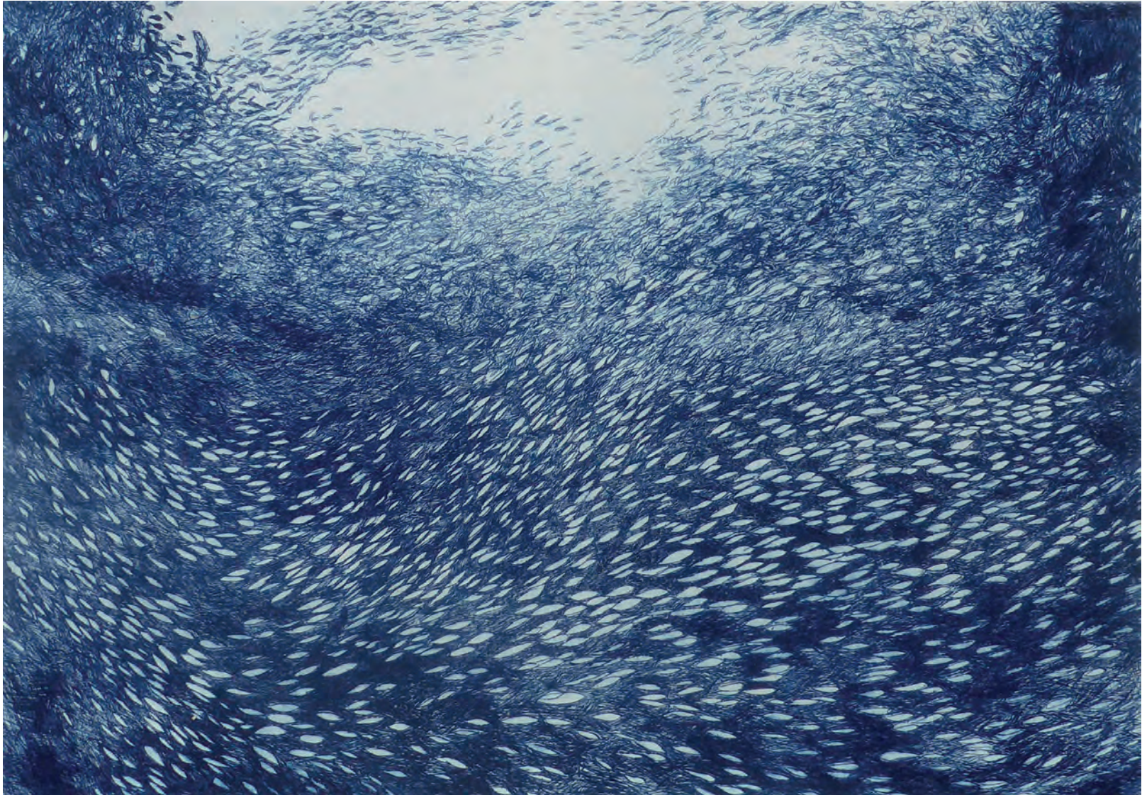
GREX V BLUE 2015 KALTNADELDRUCK 49 X 69.5 CM (MOTIV) 1/4