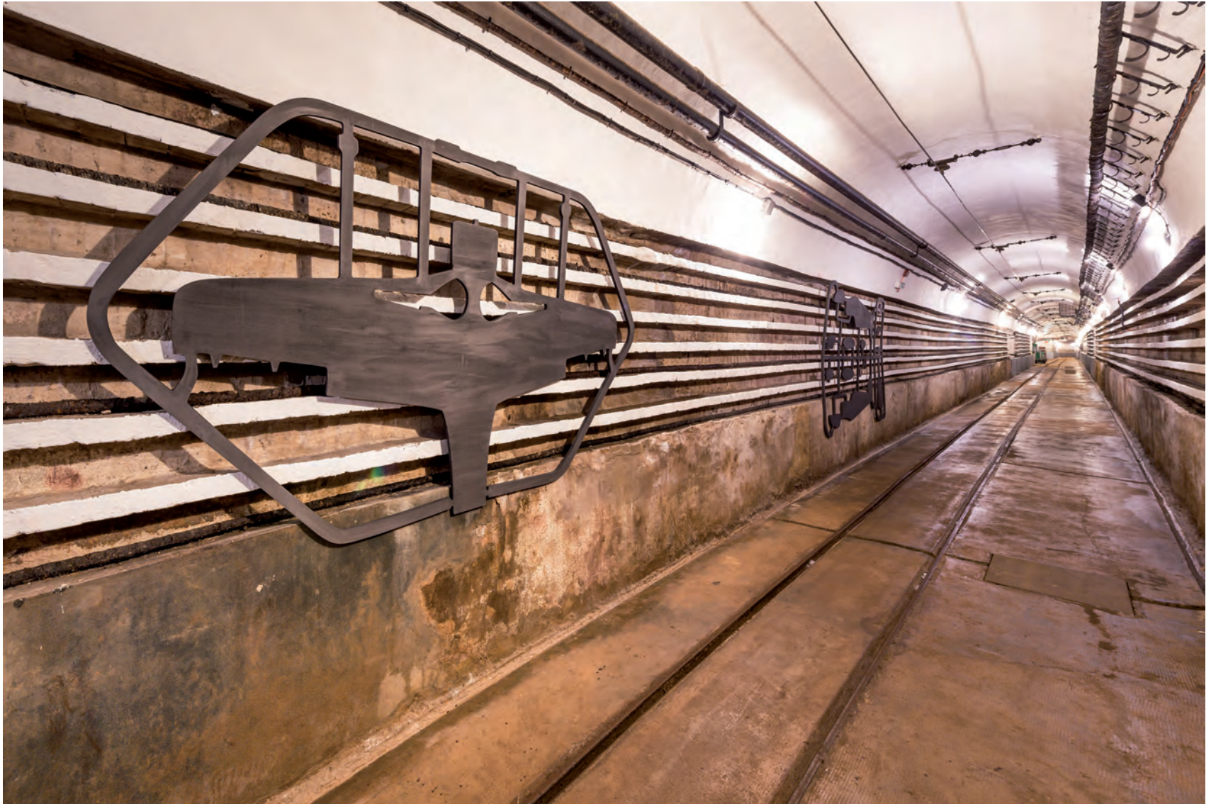
FOCKE WULF FW 190 A NACHTJÄGER 2014 MDF, GRAPHIT, 138 X 270 X 1.8CM 5 FLIEGERBAUSÄTZE AUSSTELLUNG „UNDERGROUND“ FORT SCHOENENBOURG, ELSASS