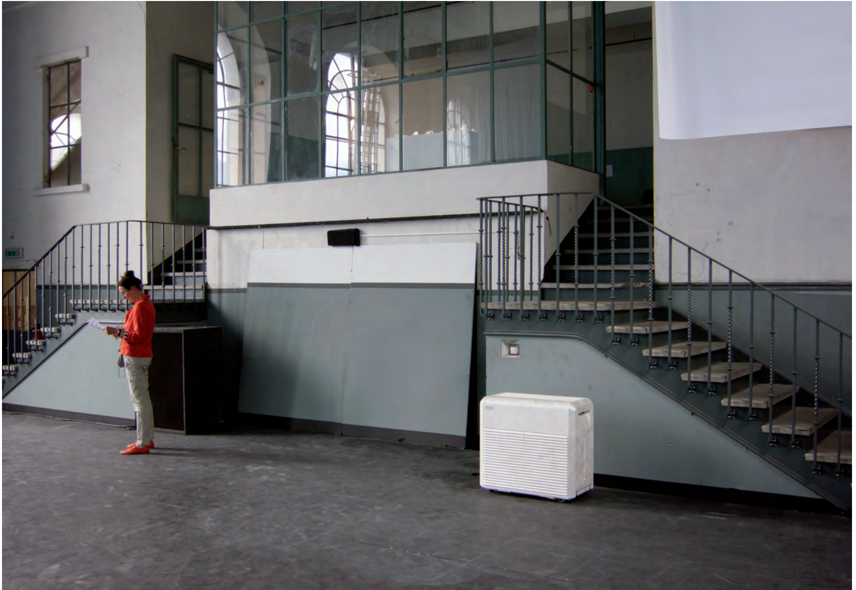
DEFENSOR I 2014 LUFTBEFEUCHTER MIT PERLMUTT - CAMOUFLAGEMUSTER AUSSTELLUNG „CURRENTS, CURTAINS, CODE“ BELLE USINE FULLY