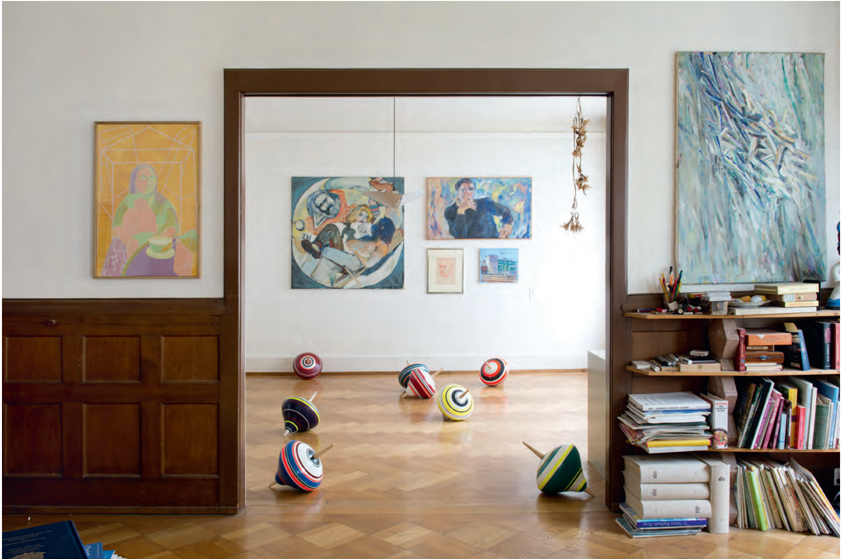
ROUNABOUT 2014 KERAMIK, HOLZ, ACRYL JE 50 X 35 X 35 CM RINGSTRASSE 2A KAMMERSPIEL OLTEN