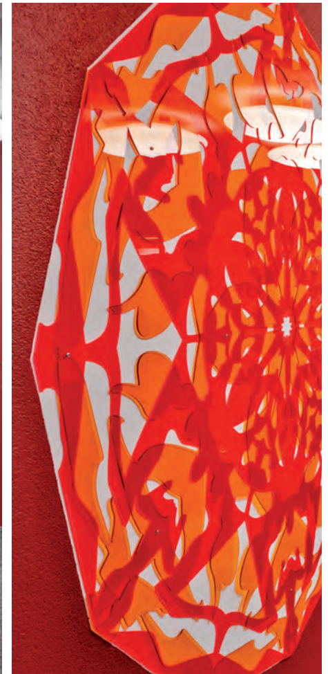
KALEIDOSKOP 2015 KUNST AM BAU FARBIGES PLEXIGLAS ø 155cm / 198cm / 155cm EINGANGSHALLE KANTONSSPITAL BRIG