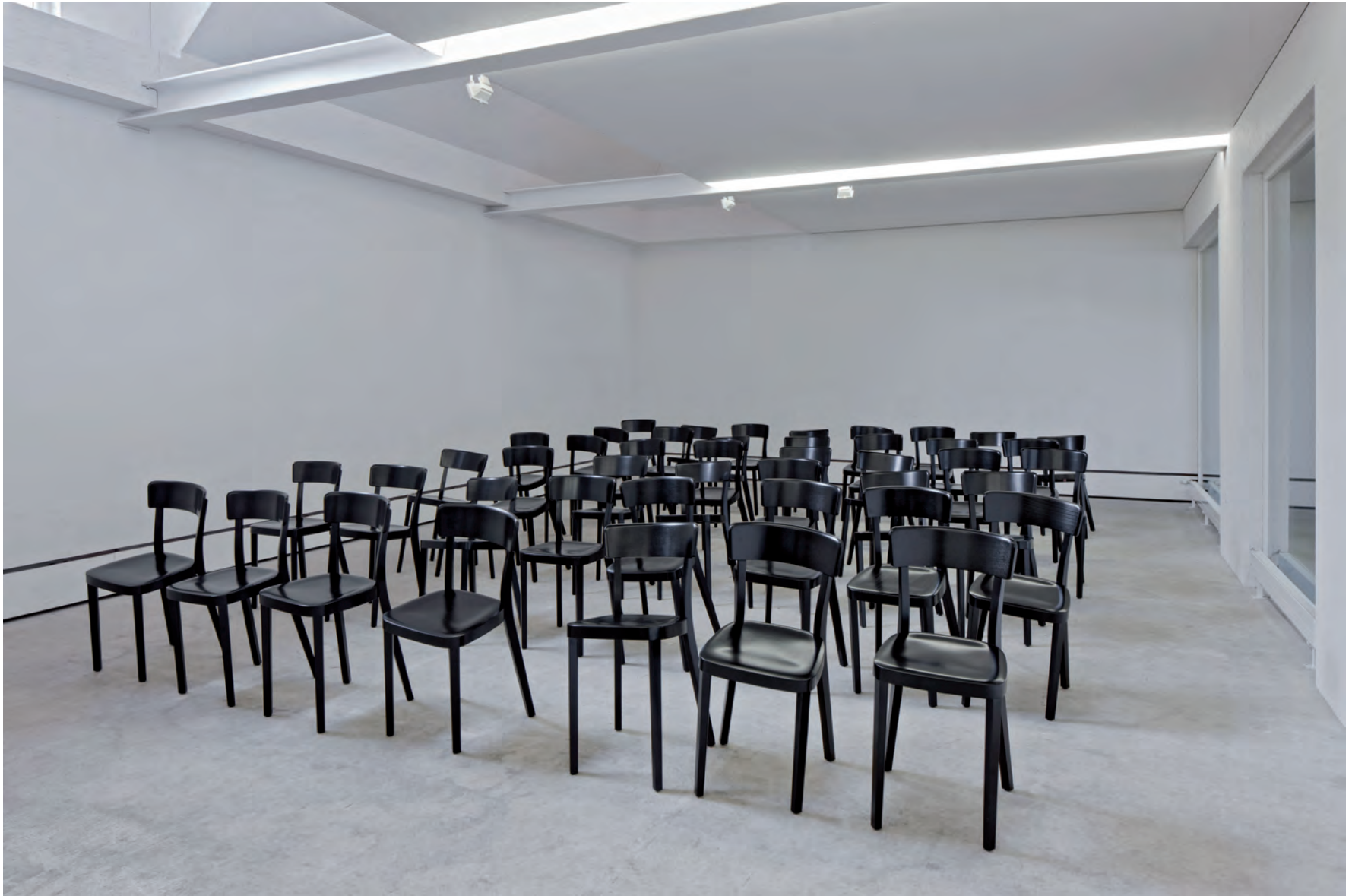
AUDIENCE FLOW 2014 INSTALLATION MIT 45 HOLZSTÜHLEN (HORGENGLARUS) GRÖSSE VARIABEL KUNSTHALLE WIL