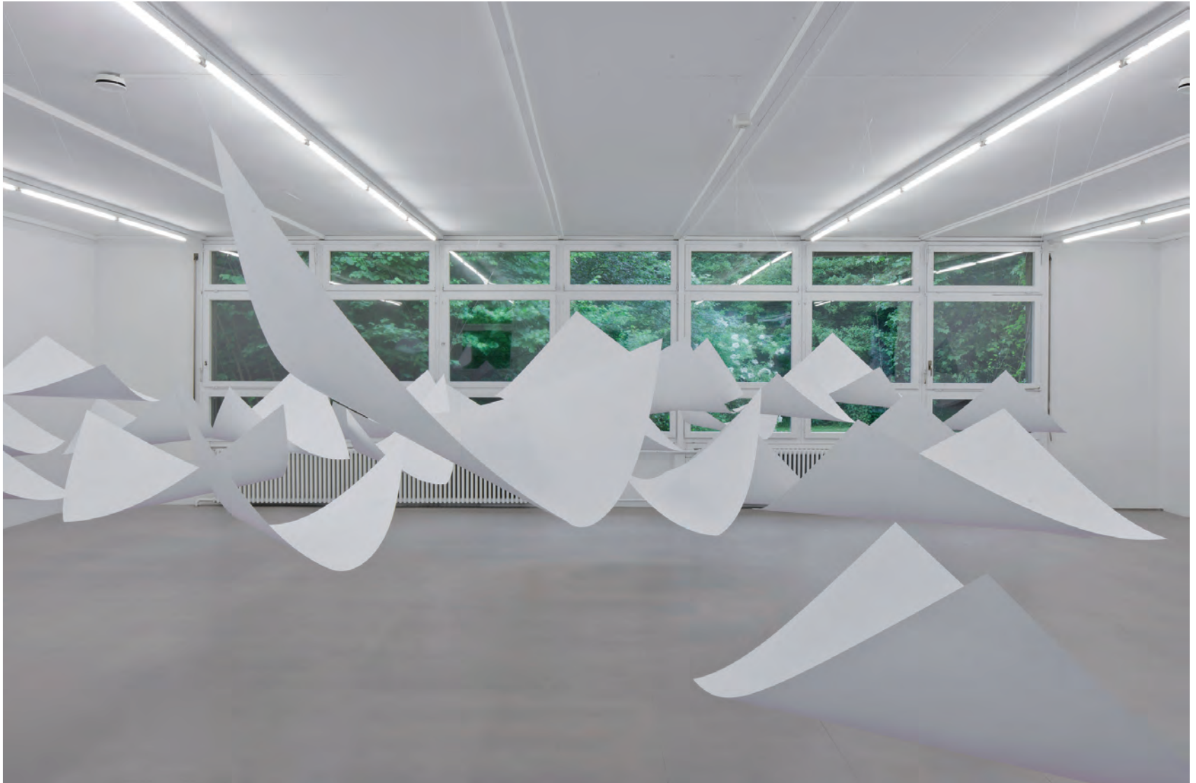
FAITES VOS JEUX! 2015 PAPIERBOGEN, SILK GRÖSSE VARIABLE O.T. RAUM FÜR AKTUELLE KUNST LUZERN