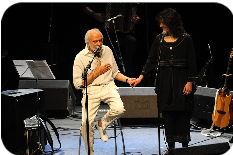
Céline Ramsauer chantant avec Georges Moustaki à l'Olympia de Paris, en mai 2008.