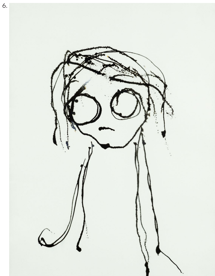
Jean Morisod «Sans titre », 2007