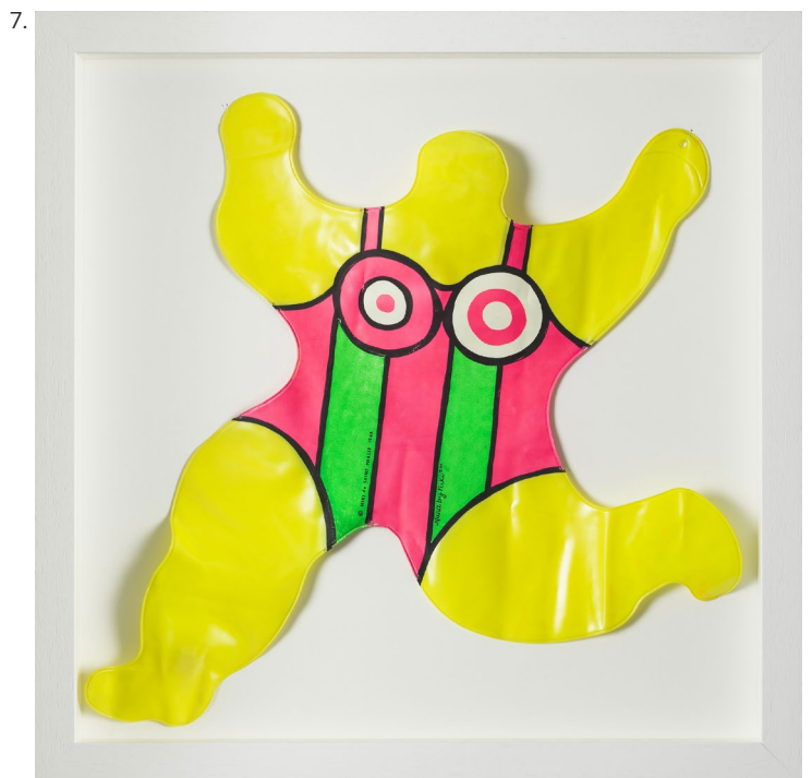
Niki de Saint Phalle « Nana gonflable jaune », 1968