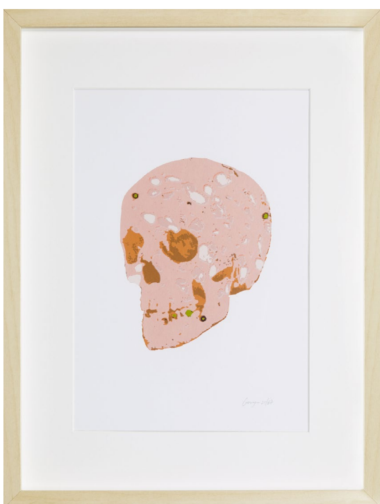
Christian Gozenbach «Skull», 2015