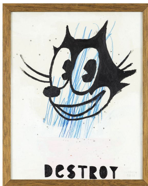
Christophe Lambert «Destroy», 2008