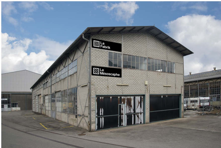
La Fabrik sur le site de l'ancienne usine Giovanola