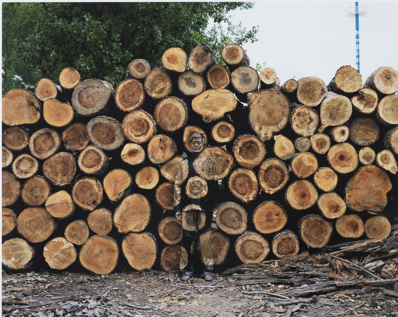
Bolin Liu «Hide in the city », 2010