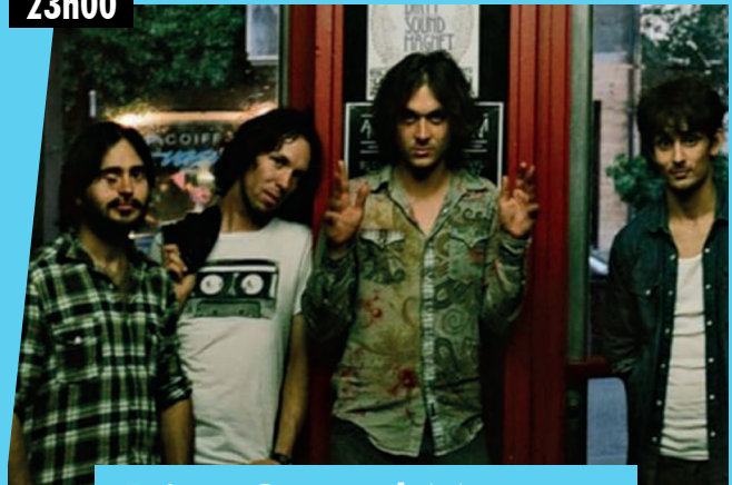
Dirty Sound Magnet