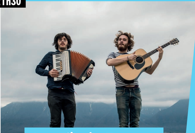
Les Fils du Facteur