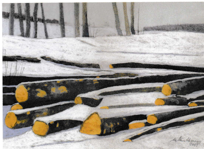
Michel Tenthorey: peinture 2019

* Epesses, Galerie Les 3 Soleils, du 8 au 30 juin 2019, vernissage dimanche 9 juin 2019 de 14-18h, memento page 25