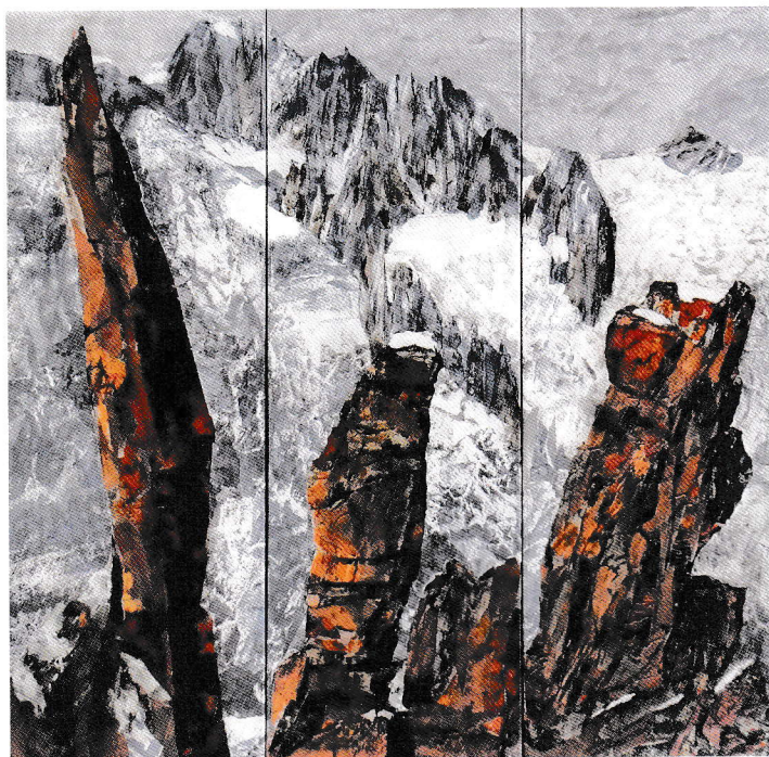
«Les Drus, Mt Blanc», collage, fusain et pastel, triptyque 3 x 30 x 90 cm

Lorsqu'on ouvre la biographie de France Schmid sur son site internet, on découvre l'analogie qu'elle tisse entre la musique des mots et l'alchimie des couleurs, donc entre la poésie et son travail de plasticienne. La démarche est similaire: intérioriser les impressions ressenties au contact de la nature, puis les restituer sur la toile. Elle cite les grands poètes romantiques qui ont chanté le lac, comme Byron et Lamartine, et les romanciers qui, à l'instar de Ramuz, ont décrit leur fascination de la montagne. Comme eux sur la page écrite, elle dépose dans ses œuvres des fragments d'elle-même.