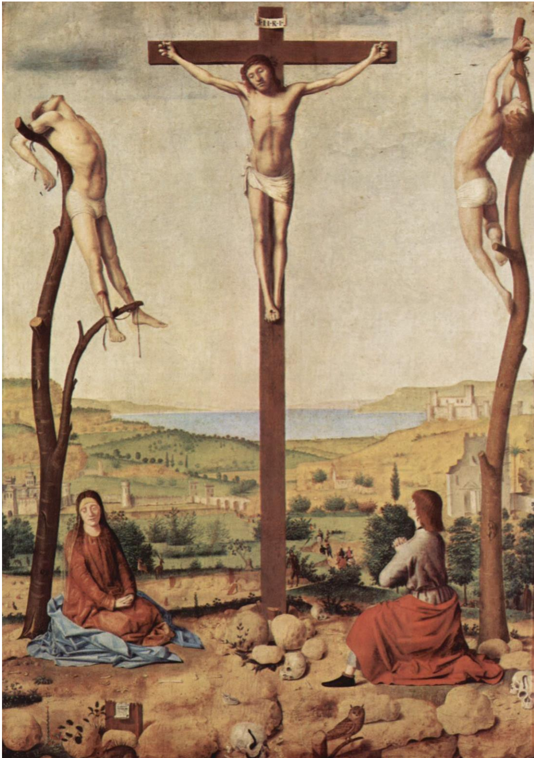
Antonello de Messine, La Crucifixion , tempera sur bois, vers 1465

ournée et, satisfait de son travail, lui propose la tournée complète qui débutera fin 2019.