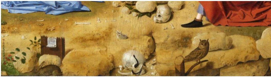
Antonello de Messine, Calvaire (détail), huile sur panneau, 1475