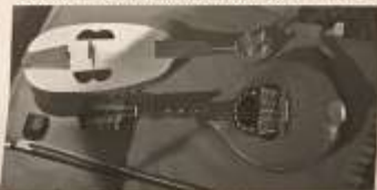
En haut une viola en bas une cistre

Pour la circonstance, le duo Hirundo Maris était accompagné de l'ensemble Res Temporis de Sion. C'est au son d'instruments anciens,