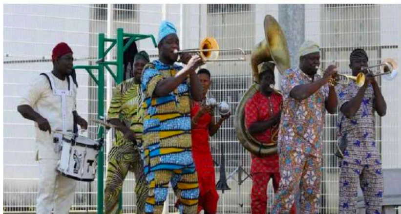
La fanfare Eyo'Nlé Brass Band dans la promenade du centre pénitentiaire.

Pour la première fois, les promenades du centre pénitentiaire montois ont accueilli un concert. Le groupe y faisait une halte avant d'enflammer le festival Les Tempos du Monde à Saint-Paul-lès-Dax, demain