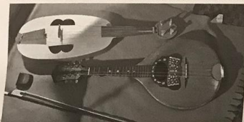
En haut une vièle en bas une cistre

Pour la circonstance, le duo Hirundo Maris était accompagné de l'ensemble Res Temporis de Sion. C'est au son d'instruments anciens,