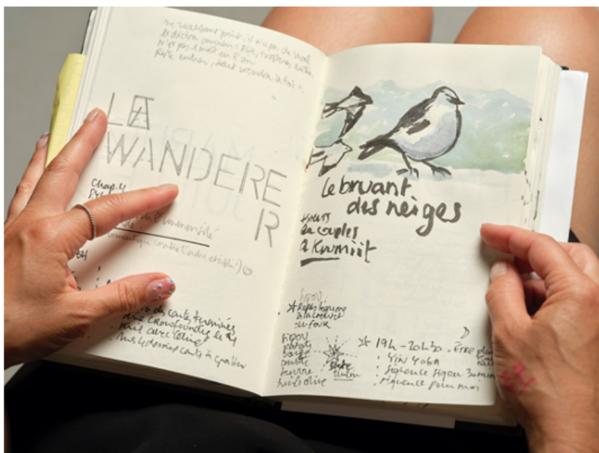
Carnet et croquis d'Alexia Turlin

Pour GRAND NORD , Alexia Turlin a invité 26 artistes qui ont participé à une ou plusieurs résidences artistiques d'un mois en arctique proposées sur concours par les associations romandes MaréMotrice et la Fondation Pacifique. Ces expéditions se déroulent de manière collective sur des voiliers – dont un voilier solaire –, avec un petit groupe d'artistes et de membres d'équipage, qui vivent et travaillent sur quelques mètres carrés. Elles ont pour objectif de documenter les changements climatiques de l'océan et des régions polaires et de porter un regard sur les communautés humaines vivant près des pôles à travers les observations d'artistes aux langages et pratiques multiples (plasticien-ne-s, comédien-ne-s, écrivain-e-s, musicien-ne-s). Naviguant silencieusement et de façon non-polluante, les voiliers servent de maison, d'atelier et de moyen de transport. Ils offrent une liberté de mouvement permettant de voyager dans des endroits accessibles par aucun autre moyen de transport.