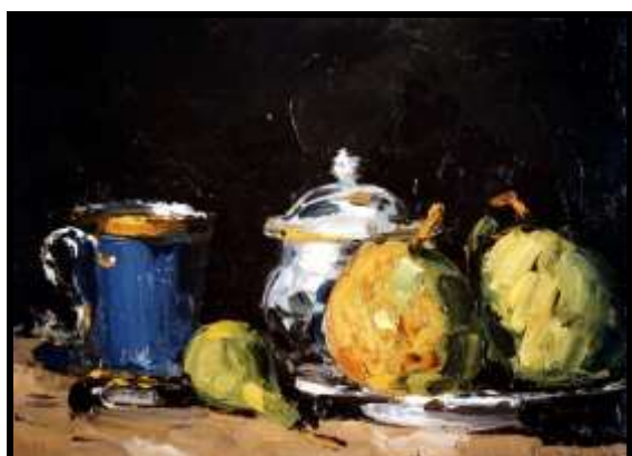
"Sucrier, poires et tasse bleue" (original)

On présente aux enfants un tableau truqué . Les enfants doivent alors chercher dans le catalogue où se situe le tableau et repérer quels sont les trucages qui ont été opérés par ordinateur. Les enfants doivent aussi désigner le titre de l'œuvre et son année de création. Un contexte supplémentaire de l'œuvre utilisée peut être transmis (pourquoi, comment,...).