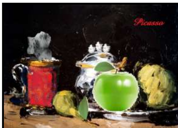
Tableau truqué (7 erreurs)