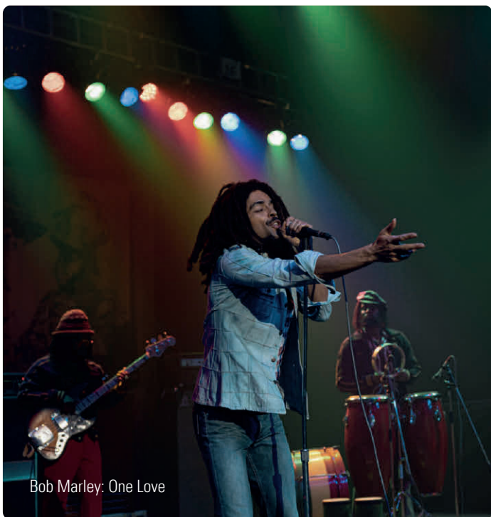
Bob Marley: One Love