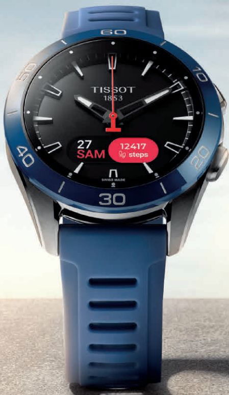
TISSOT T-TOUCH CONNECT SPORT