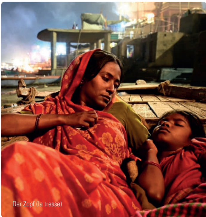
Der Zopf (la tresse)