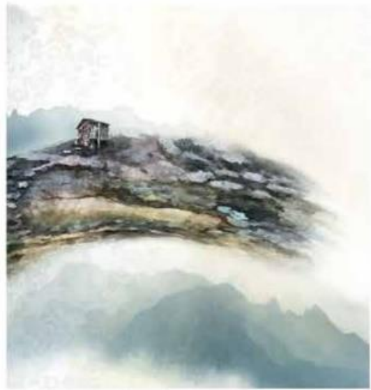
LE RACCARD | ESTAMPE | 60 x 60 | TIRAGES LIMITES