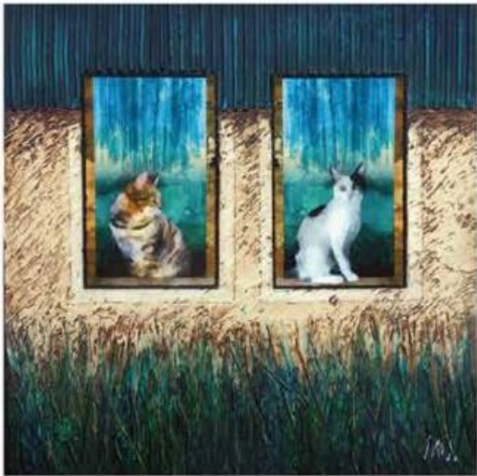
LES VOISINES | 40 x 40 | COLLAGE | ACRYLIQUE | TECHNIQUE MIXTE