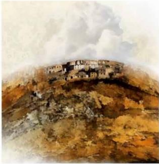
TERRE TIBETAINE | ESTAMPE | 60 x 60 | TIRAGES LIMITES